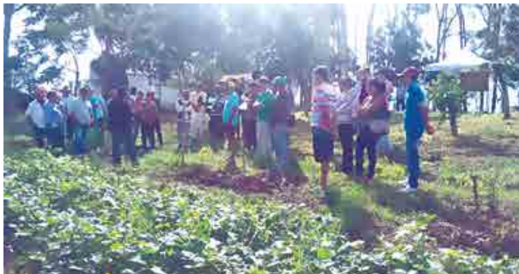
Pequenos agricultores participaram do Dia Especial do Manejo Agroecológico no município de Lagoa Seca