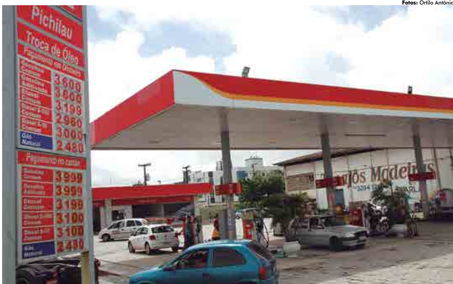
Maioria dos postos de combustíveis de João Pessoa já reajustou os valores nas bombas, inclusive com diferença de preços para pagamento em dinheiro ou cartão

Aumento do PIS/Cofins, na dimensão em que foi realizado, mais que dobrando seu valor no caso da gasolina, terá grande e imediato reflexo nos preços