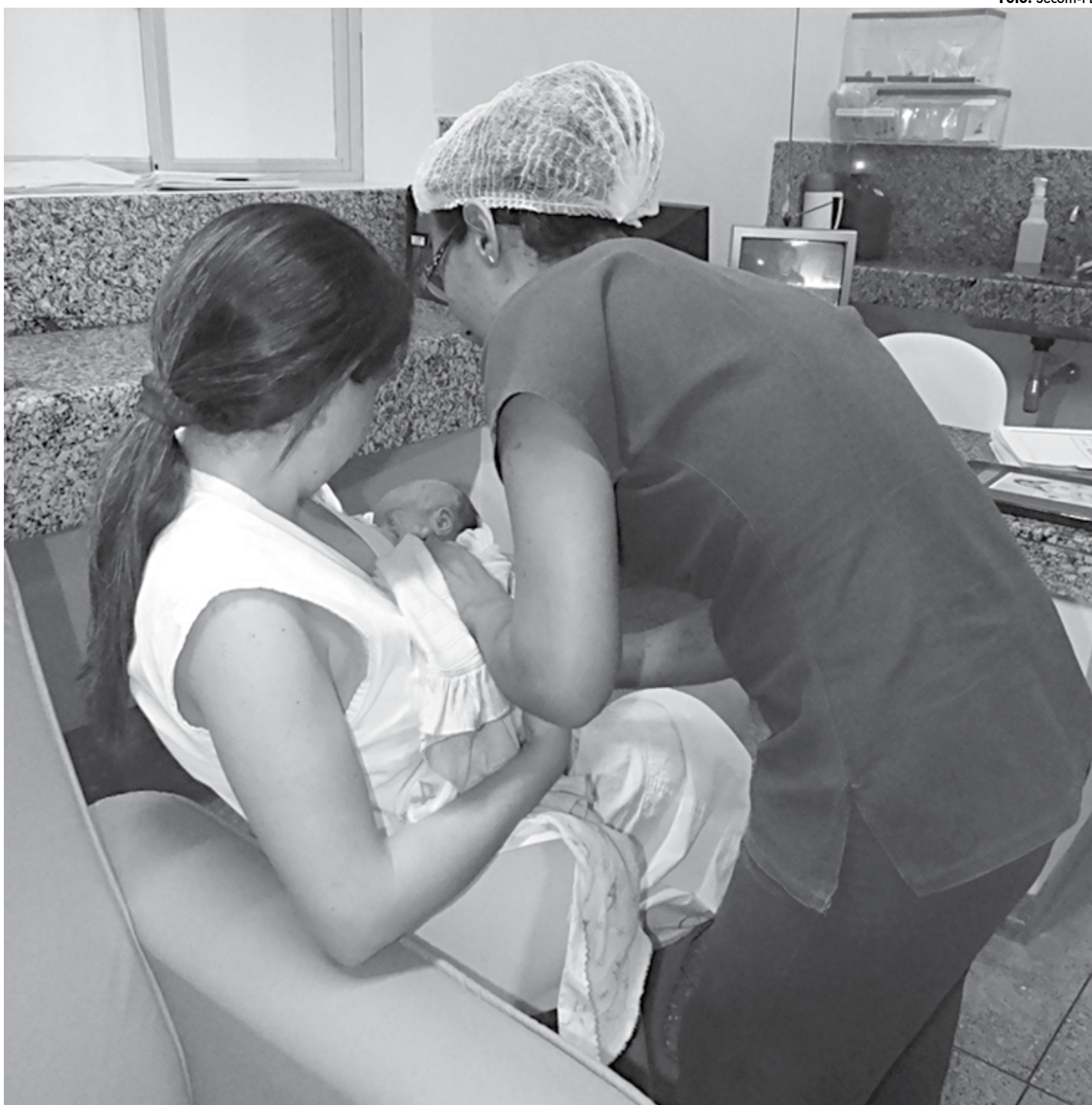
Mulheres de 66 cidades da região das Espinharas e até de outros estados como Pernambuco e do Ceará são atendidas na Maternidade Dr. Peregrino Filho

O relatório de atividades do último semestre da maternidade aponta ainda que foram realizadas 257 cirurgias, 786 consultas ambulatoriais a gestantes, 2.631 internações, 2.706 atendimentos ambulatoriais e ainda 1.814 exames de mamografia. Os casos de urgência e emergência totalizaram 6.710 atendimentos no período. Destaca-se ainda a quantidade de exames laboratoriais, que chegou a