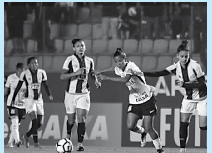
O Santos conquistou esta semana o Campeonato Brasileiro Feminino