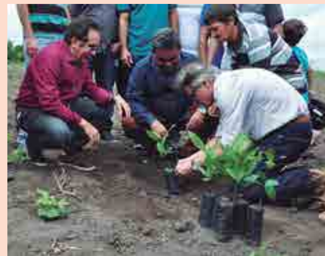
Mudas foram plantadas em dois assentamentos do município de Mari

Governo e prefeitura entregaram 10 mil mudas a 50 agricultores familiares assistidos pela Emater