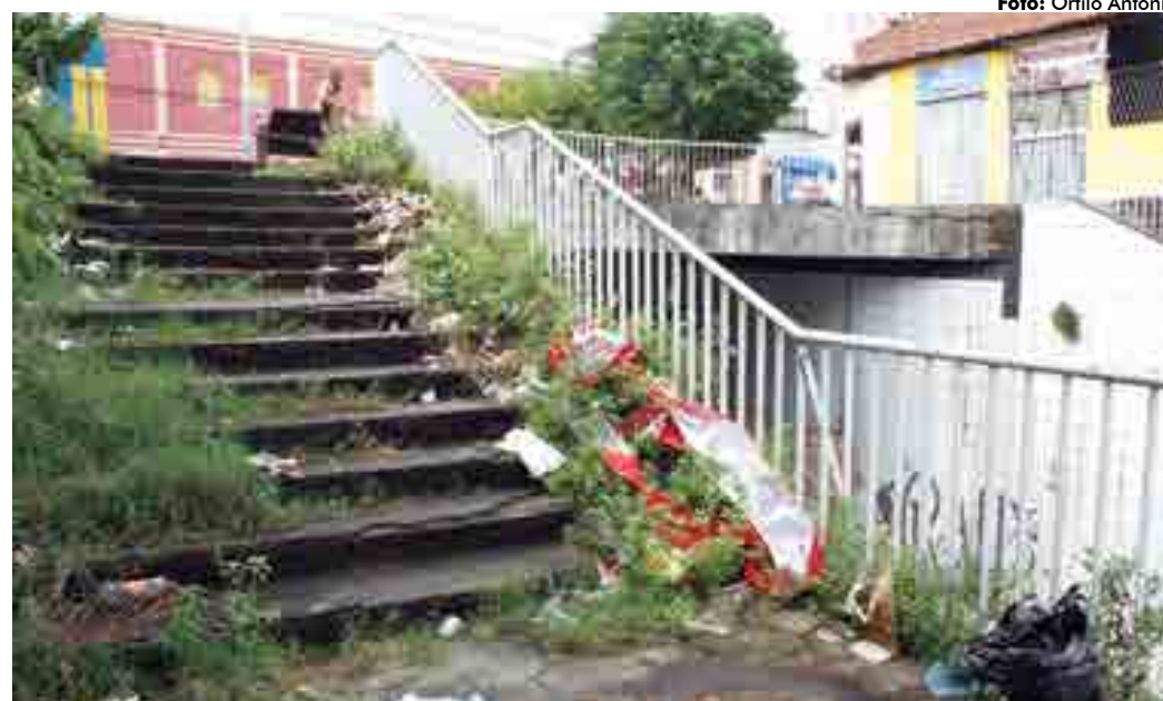
Prefeitura alega limpar locais semanalmente, mas lixo e mato acumulados demonstram outra realidade

[...] "A equipe do Núcleo de Limpeza do Centro da cidade cuida semanalmente da manutenção dos viadutos Prefeito Damásio Franca e