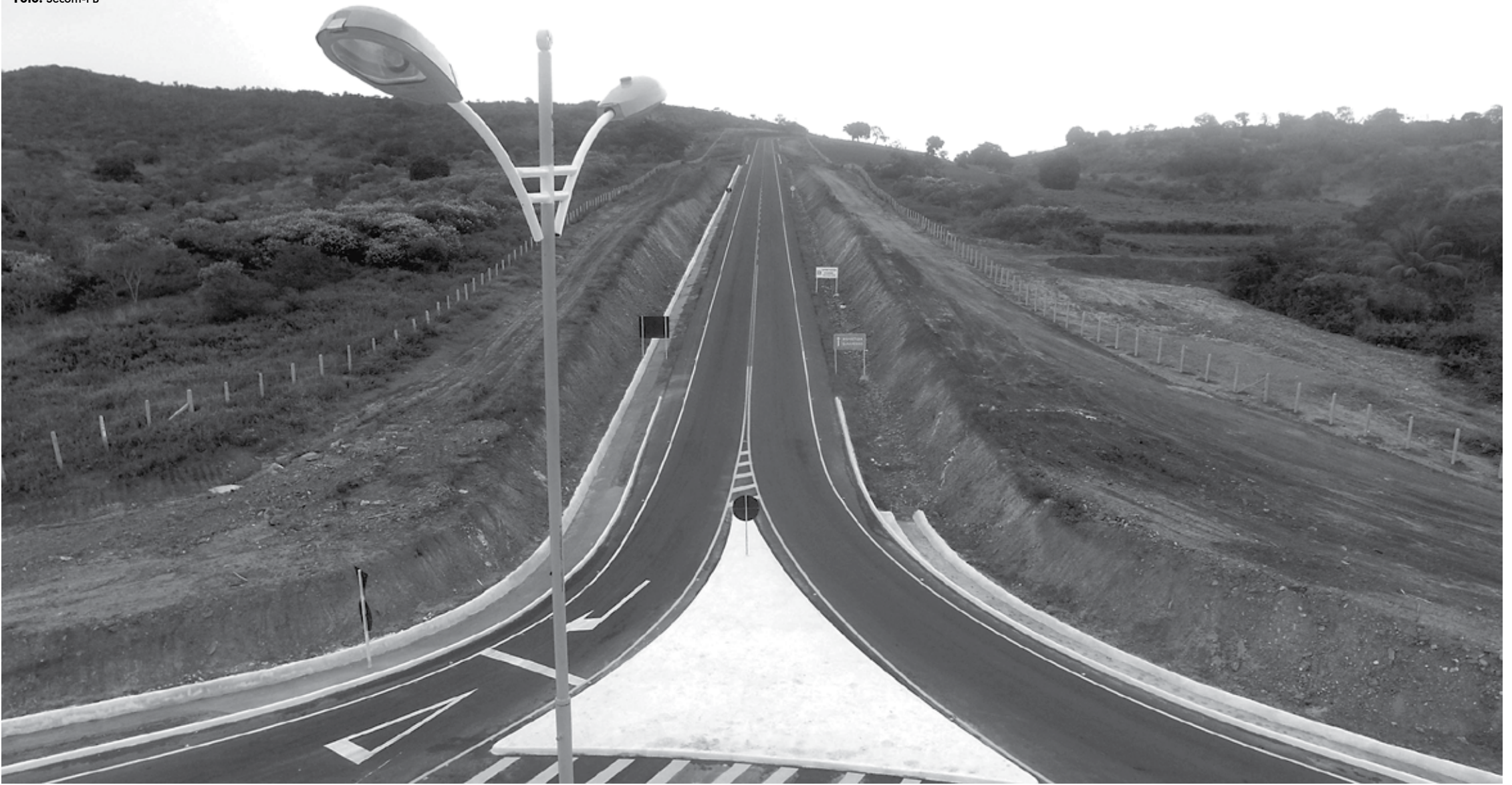
Contorno possui uma extensão de 8km e recebeu investimentos superiores a R$ 9 milhões, recursos oriundos do próprio Tesouro Estadual, e vai desafogar o tráfego de veículos no centro da cidade de Guarabira, principal município da região