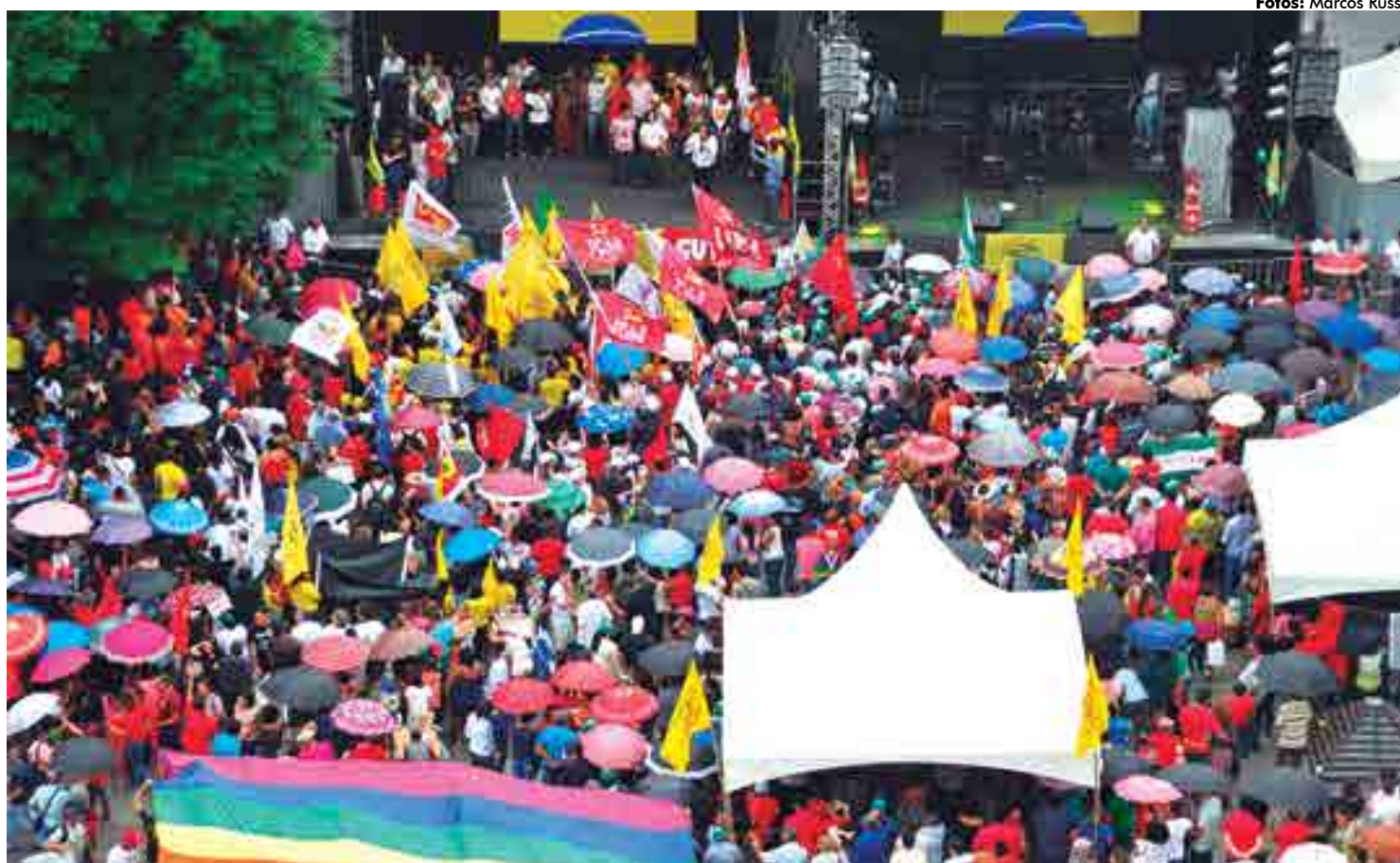
Evento reuniu lideranças nacionais, trabalhadores rurais, sindicalistas e teve apresentações culturais com artistas locais intercaladas aos discursos

"As manifestações que estão acontecendo em várias partes do país são respostas de uma população que não aguenta mais as barbaridades que este governo vem realizando. Temos que unir as forças e exigir eleição direta como o melhor caminho", disse. O senador do PSB, João Capiberibe, enalteceu o ato simbólico de um início de força que começou em João Pessoa e se estenderá por outros estados, ao reunir to-