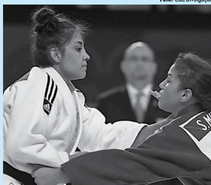
Menezes (D) lutará por uma medalha inédita em seu novo peso