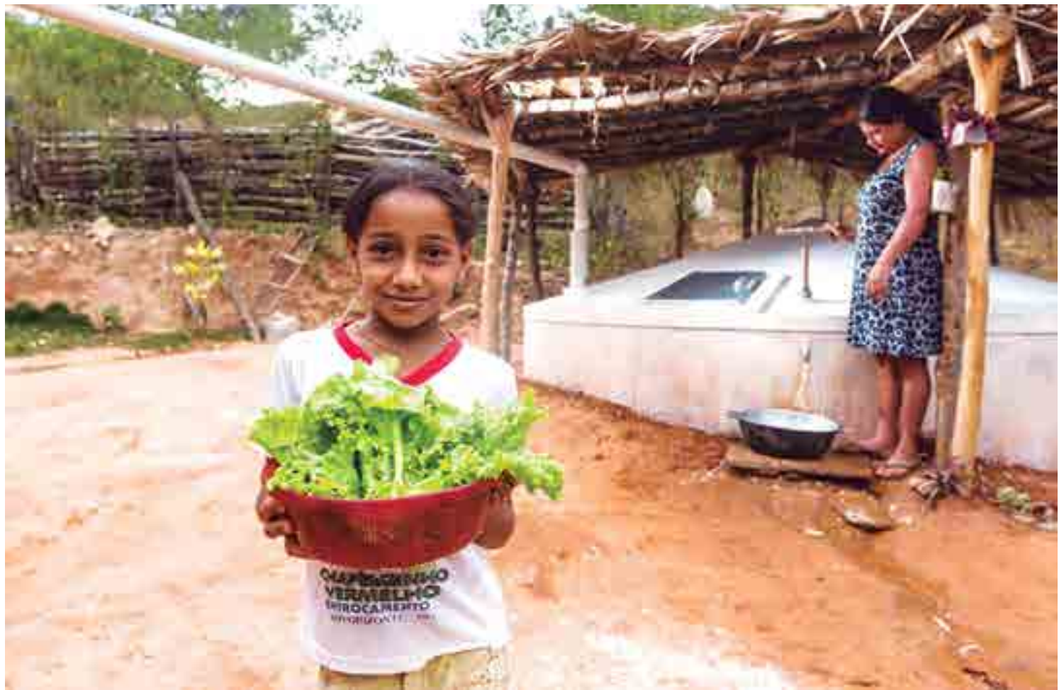
Cisternas possibilitam a produção de alimentos e a criação de animais, além de facilitarem o acesso de famílias e alunos de escolas rurais à água na região

Para a indicação ao prêmio, foram analisadas a capacidade destas políticas públicas de proteger a vida e os meios de subsistência nas terras áridas e de promover o combate à desertificação, a restauração da terra e do solo degradados, incluindo as terras afetadas pela desertificação, a seca e as inundações. Esta é a décima edição do prêmio e a primeira vez que aborda este tema. Para a seleção, o World Future Council e um seletivo grupo de organizações internacionais indicam as melhores políticas que influenciam o desenvolvimento sustentável para as gerações atuais e futuras.