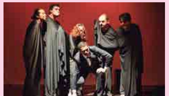
Espectáculo sobre a vida de Augusto dos Anjos acontece hoje e amanhã

A exposição ficará aberta ao público no Cine Teatro São José até o dia 30 de julho, e pode ser visitada nos turnos da manhã, tarde e noite. Uma boa opção para escolas e universidades.