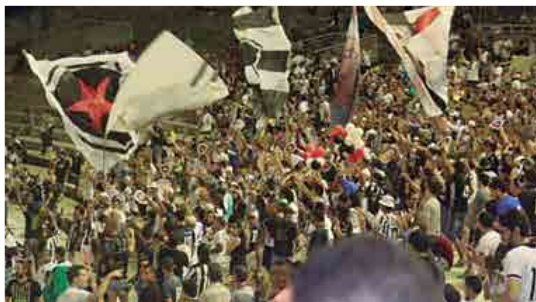
Clube precisa do apoio do torcedor para superar o River do Piauí que está à frente com 15 mil apostas a mais

Para tanto, o clube está com uma campanha de vender sacolas ecológicas, contendo volantes da Timemania dentro. Isto está sendo feito