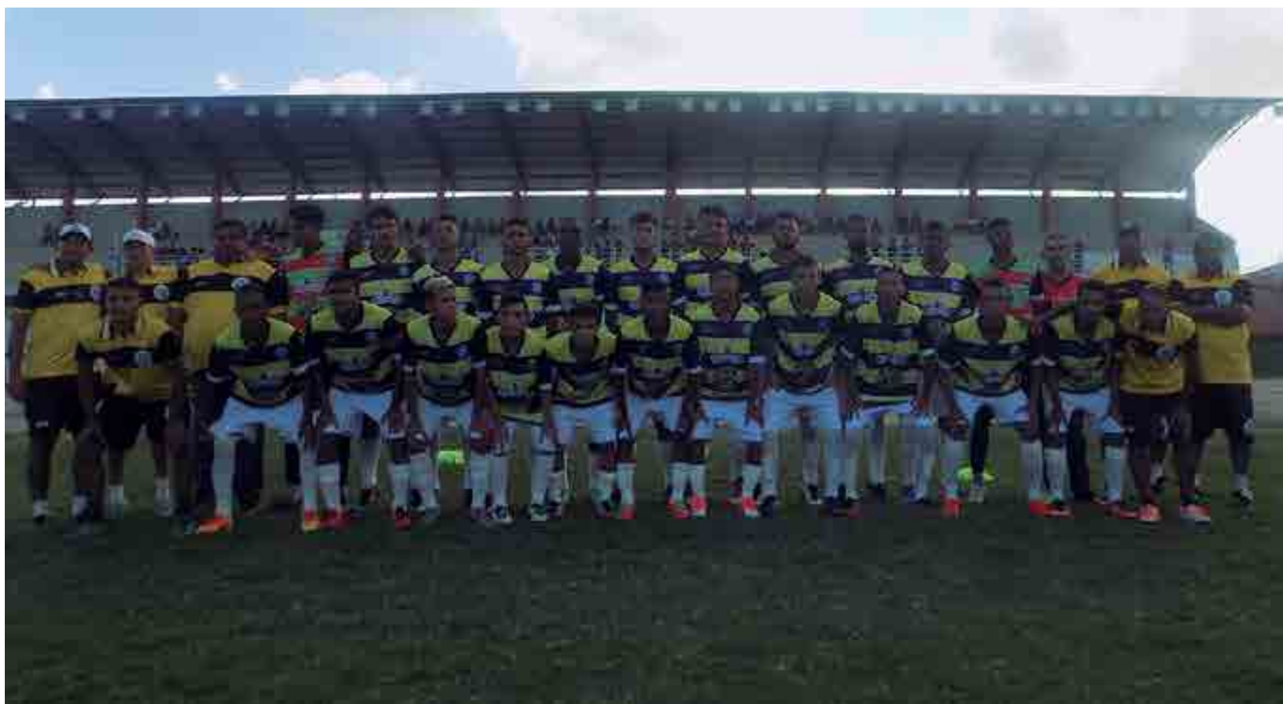
O elenco do Lucena, que está brigando pelo título do Campeonato Paraibano Sub-19 e pela única vaga para as disputas da Copa São Paulo de Futebol Júnior, que acontece em janeiro de 2018