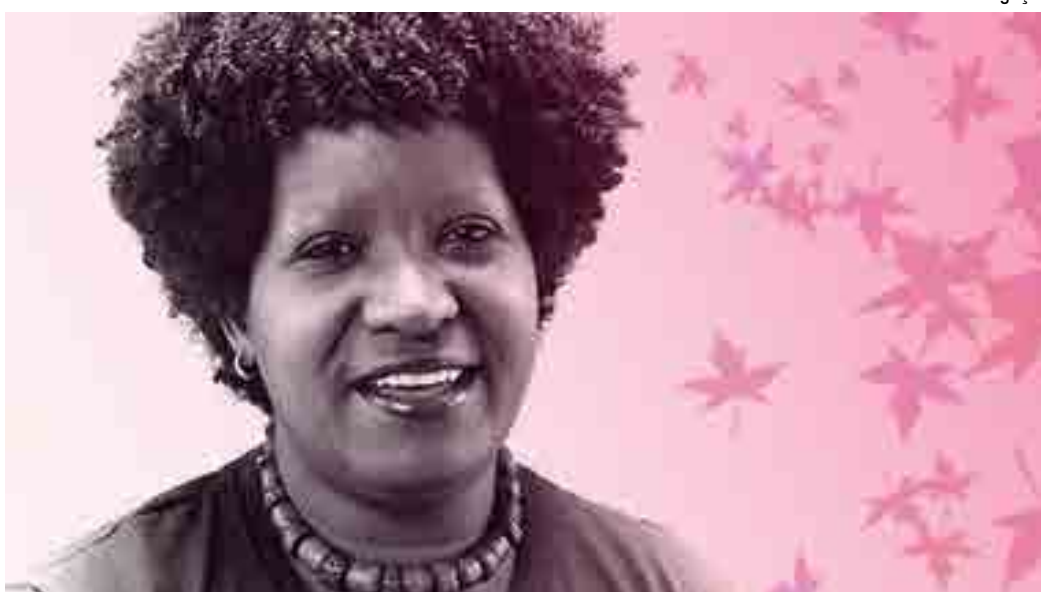
Ação integra o Projeto Memória, da Fundação Banco do Brasil, em parceria com a Rede de Desenvolvimento Humano (Redeh)

Na Paraíba, o material está aos cuidados da Organização de Mulheres Negras Bamidelê, que fez a