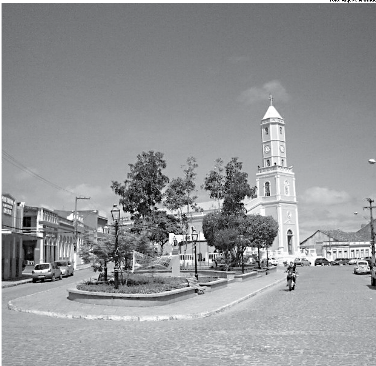
O patrimônio arquitetônico-histórico e cultural da cidade de Areia é um dos que serão alvo de fiscalização pelo Tribunal de Contas da Paraíba

Descaracterização arquitetônica dos principais centros urbanos das cidades paraibanas e falta de preservação do acerto serão tema de debate entre o tribunal, Iphaep, CREA e as Secretarias Municipais de Turismo e Meio Ambiente